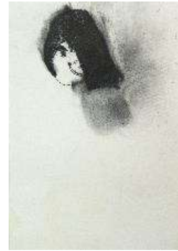
作品名 無題 作者名 白井望 (しらいのぞむ) サイズ 788×1091mm