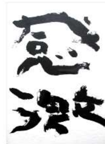
作品名 無題 作者名 深田隆 (ふかだたかし) サイズ 1091×788mm