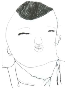
作品名 無題 作者名 白井望 (しらいのぞむ) サイズ 788×1091mm