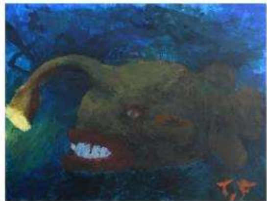
作品名 深海の自画像 作者名 深田隆 (ふかだたかし) サイズ 1120×1455mm