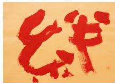
作品名 絆 作者名 深田隆 (ふかだたかし) サイズ 545×788mm