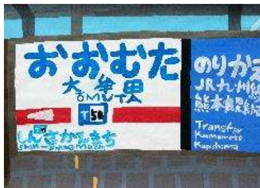
作品名 無題 作者名 杉山統基 (すぎやまもとき) サイズ 788×1091mm