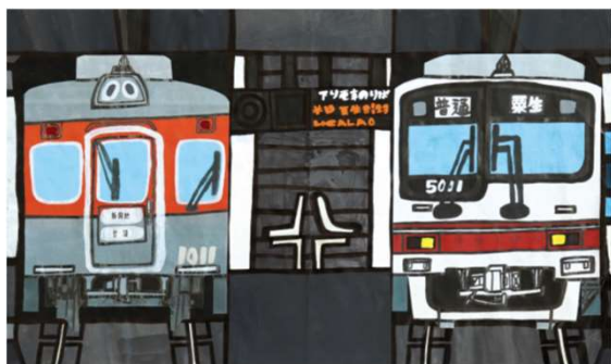
作品名 無題 作者名 杉山統基 (すぎやまもとき) サイズ 788×1091mm