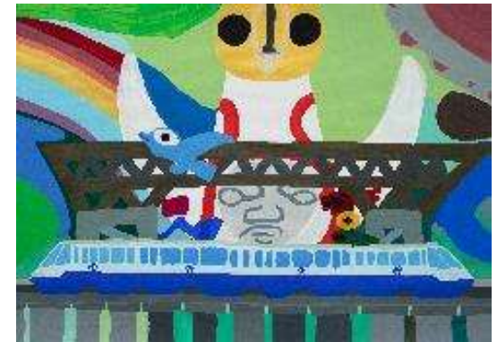
作品名 大阪万博50周年 作者名 杉山統基 (すぎやまもとき) サイズ 788×1091mm