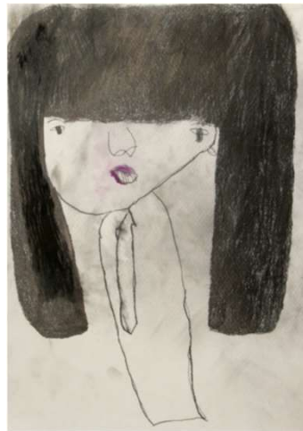
作品名 無題 作者名 白井望 (しらいのぞむ) サイズ 788×1091mm