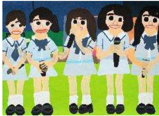
作品名 無題 作者名 杉山統基 (すぎやまもとき) サイズ 788×1091mm