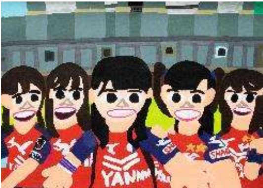
作品名 無題 作者名 杉山統基 (すぎやまもとき) サイズ 788×1091mm