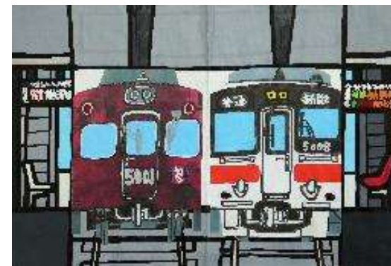
作品名 無題 作者名 杉山統基 (すぎやまもとき) サイズ 297×420mm