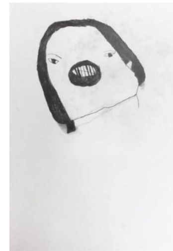
作品名 無題 作者名 白井望 (しらいのぞむ) サイズ 788×1091mm