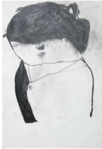
作品名 無題 作者名 白井望 (しらいのぞむ) サイズ 788×1091mm