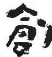
作品名 創 作者名 深田隆 (ふかだたかし) サイズ 510×720mm