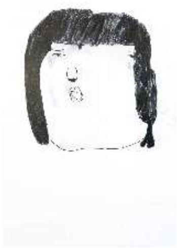
作品名 無題 作者名 白井望 (しらいのぞむ) サイズ 788×1091mm