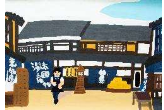
作品名 無題 作者名 杉山統基 (すぎやまもとき) サイズ 788×1091mm