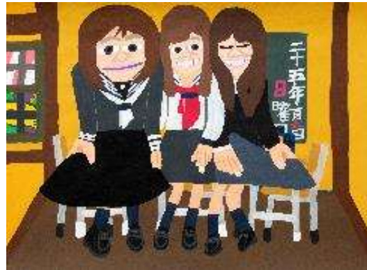
作品名 女学生の姿に、タイムスリップ 作者名 杉山統基 (すぎやまもとき) サイズ 788×1091mm