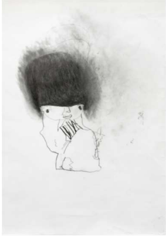
作品名 無題 作者名 白井望 (しらいのぞむ) サイズ 788×1091mm