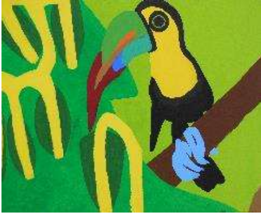
作品名 無題 作者名 杉山統基 (すぎやまもとき) サイズ 803×1000mm