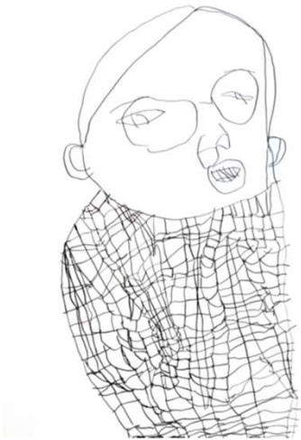
作品名 無題 作者名 白井望 (しらいのぞむ) サイズ 788×1091mm