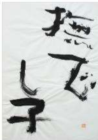
作品名 撫でし子 作者名 深田隆 (ふかだたかし) サイズ 788×545mm