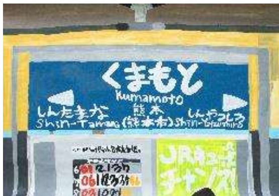
作品名 無題 作者名 杉山統基 (すぎやまもとき) サイズ 788×1091mm