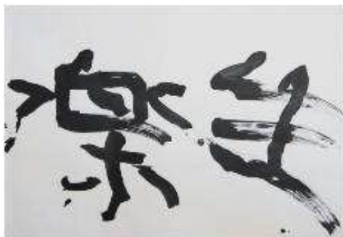
作品名 楽生 作者名 深田隆 (ふかだたかし) サイズ 545×788mm