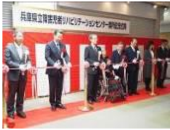
かいしよ きねんしきてん 【開所記念式典】

ぎょうむ かいし がつ にち ど かいしよ きねんしきてん かいさい しせつけんがくとう おこな 業務開始にあたり、2月1日（土）に開所記念式典を開催し、施設見学等を行いました。