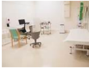
しんさつしつ 【診察室】