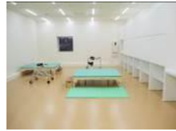
【リハビリテーション室】