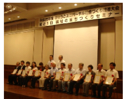
さくねんど ようす 昨年度の様子