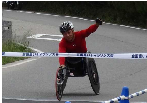
たいかいとうじつ ようす 大会当日の様子