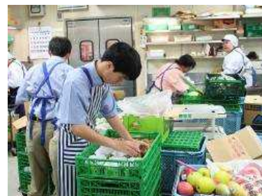
くんれん ようす ひだり か みぎ そうごうじつむか 訓練の様子(左:ものづくり科、右:総合実務科)