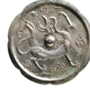
雲龍紋八花鏡 (うんりゅうもんはつかきょう)