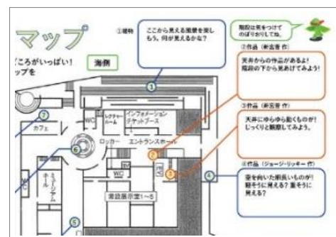
美術館探検マップ部分