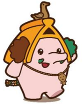
キャラクター:ほったん

兵庫県教育委員会が令和5年度に実施した沖代遺跡(太子町)、才村遺跡(姫路市)をはじめとする最新の発掘調査成果や、出土品調査によって刊行した報告書の中から、 いかるが 鶺鴒北遺跡(太子町)、広峰遺跡(豊岡市)などの資料を展示します。併せて、ひょうご五国のうち但馬地域をテーマに取り上げ、当館が所蔵する深田遺跡・袴狭遺跡(豊岡市)の古代官衙に関する出土品など、地域の歴史や特徴を示す資料を紹介します。 詳細はこちら