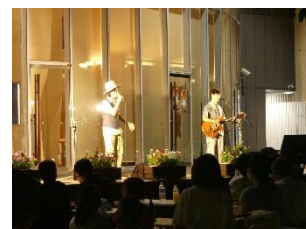
※「HAT減災サマー・フェス（過去開催写真）」を紹介