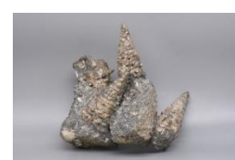
岡山県津山市産のピカリア(巻貝)