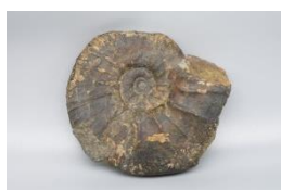
南あわじ市産のパキディスカス(アンモナイト)