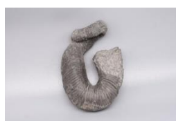
洲本市産のノストセラス(アンモナイト)