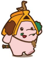
キャラクター:ほったん