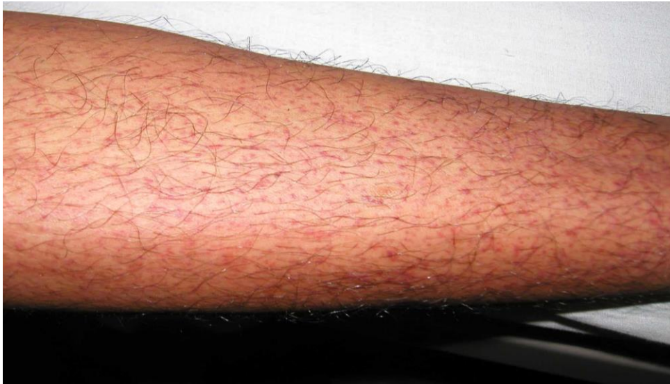
図 1. デング熱患者の発疹：解熱時期にみられた点状出血