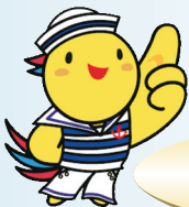
兵庫県マスコット はばタン

乳がん・子宮がんは、比較的若い世代が罹患しているんだね! 胃がん・肺がん・大腸がんは、40歳後半から増えているね!