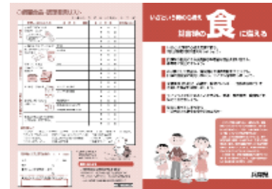
【～いざという時の心構え 災害時の食に備える～】