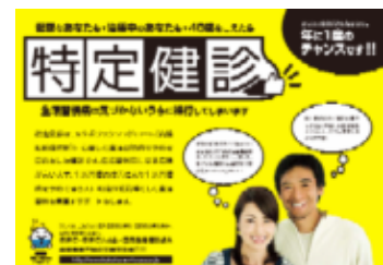
【受診勧奨ポスター】