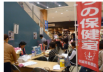
石巻市における「まちの保健室」