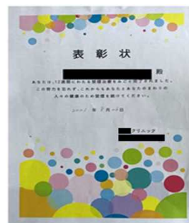
禁煙外来通院クリニックからの表彰状

上記の他、歯科健診受診時の費用補助及び特別休暇対応や運動施設利用料、健康機器の購入等に活用することができる助成金制度（年間1人当たり3,000円）の導入、社内グループウェアシステムを活用した健康情報の提供など様々な取組を実施