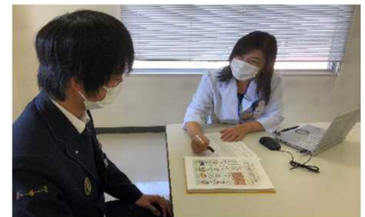
社内保健師による保健指導の様子