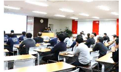
健康セミナーの様子