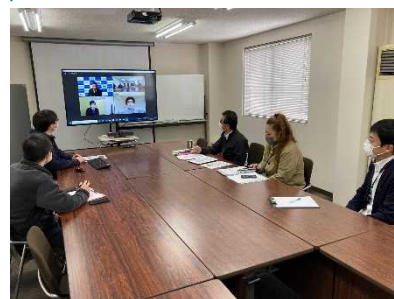
健康づくり推進委員会 開催風景

【効果】社員の健康課題の把握、ニーズの高い健康分野に関するセミナーの企画、開催及び新規施策の導入