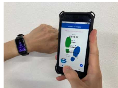
健康アプリとスマートウォッチ

【効果】社員のメタボリックシンドローム該当率の低下、脂質リスク保有率の低下、運動を継続的に実施している者の割合増加等