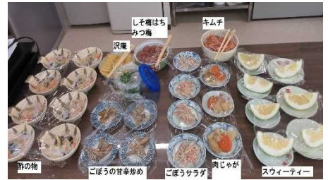
栄養バランスに配慮した昼食献立