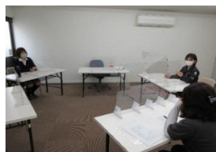
ミーティングの様子

【効果】経営者層の理解と協力を得られた。ワークライフバランスの推進により従業員が子育てや介護等と仕事の両立が実現したことで 残業時間が減少し、働き甲斐と働きやすさの両輪がかみ合うようになった。健康診断の再受診率100%を達成できた。