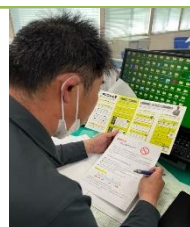
研修及び禁煙外来働きかけ