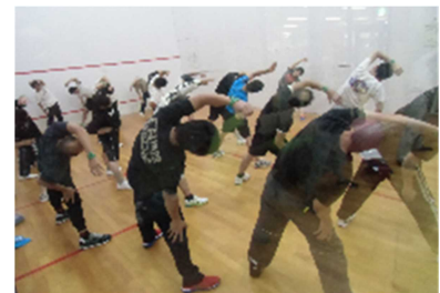
健康教室の実施風景