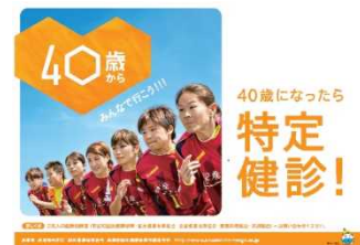
27 年度啓発ポスター