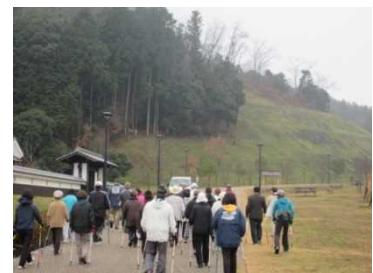
ウォーキングの実施風景

健康づくり・地域づくりをテーマに実践的な講習会を各地で開催 <実績> 豊岡市ほか 22 回 延 561 人