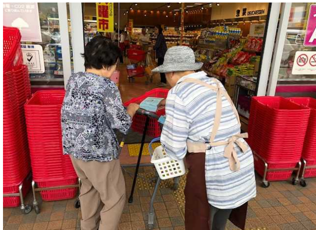
来客された市民へいずみ会員がチラシを配布している様子