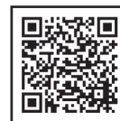
(メールマガジン利用規約)