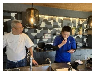
経営者自ら食育を実践

社内キッチンによる24時間自炊環境の整備や自社レストランの野菜中心弁当の提供、朝食おにぎりイベントや災害時炊飯チャレンジ、健康アプリ・情報発信を組み合わせ、勤務形態に左右されない健康的な食選択環境を構築した。 【効果】社内キッチンは月平均73名が利用。朝食欠食率は62%→39%へ改善。