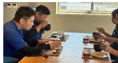
朝食おにぎりイベントの様子