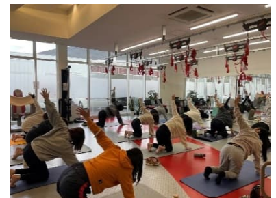
ヨガ・ピラティスの様子