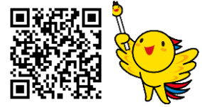
【県メールアドレス QR コード】