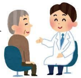
認知症健診・もの忘れ相談