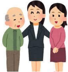
認知症地域支援推進員の配置 認知症ケアパスの作成・普及啓発