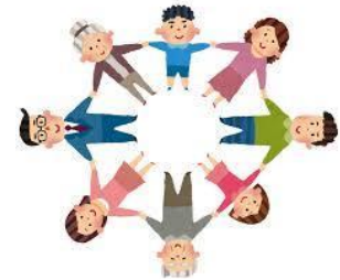
SOSネットワークの構築 GPS端末貸し出し

事前登録者40名 (靴に貼るステッカー配布) 登録協力機関68件 行方不明事案0件