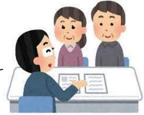
認知症相談センターの設置