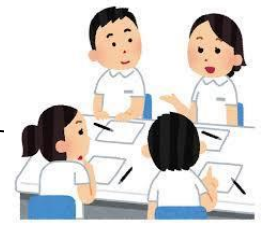
認知症初期集中支援チームの設置

事前登録者40名 (靴に貼るステッカー配布) 登録協力機関68件 行方不明事案0件