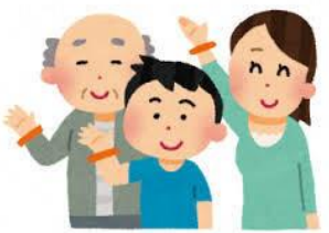
認知症サポーター養成講座の実施