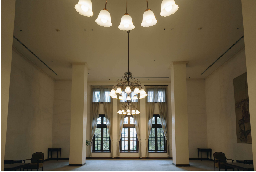
兵庫県公館 3階 南ロビー