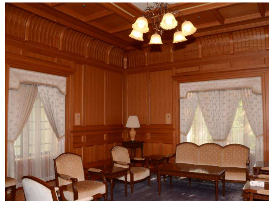
左：<南玄関正面>ルネサンス様式 半円アーチ型の窓 右：<貴賓室>天井・壁・全てケヤキむく板で作成