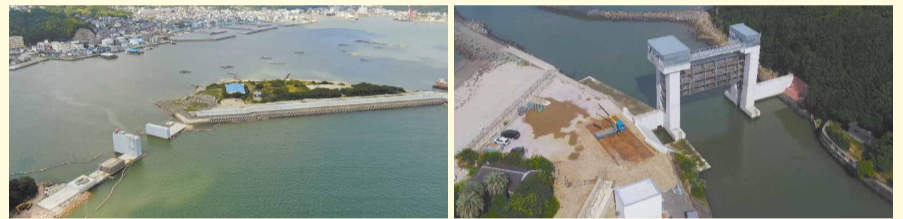
福良港湾口防波堤の整備(23年8月撮影)

津波被害を軽減させる防波堤や防潮堤、水門の整備を進めており、福良港、阿万港では、2024(令和6)年早期の完成に向け取り組んでいます。津波を完全に防ぐことはできません。地震が発生したらすぐに高台に逃げてください。