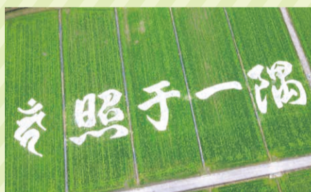
昨年の「田んぼアート」の様子

姫路市夢前地域では、食と農で結ぶ夢街道づくり実行委員会*が中心となり、ランタン祭りをはじめさまざまな集客イベントを開催しています。11月から来年4月までは、ナスカの地上絵を模した「書写の地上絵」「田んぼアート」が登場予定です。