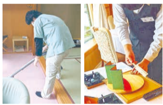
インターンシップでは清掃や配膳などを体験。

常日頃から、障害があっても活動を制限されるべきではないと思っています。できる仕事はたくさんありますし、実際に体験することで得意と感じられる仕事が見つかることも。有馬での体験が自信につながり、社会に出るきっかけになればうれしいです。また、実習生を受け入れることで他の従業員も、障害