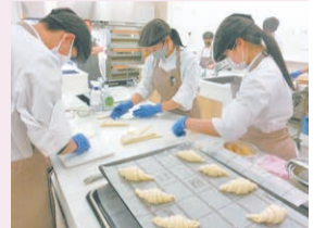
製菓衛生士の受験資格が取れるパティシエコースでは、週8時間の実習があります。

ど大量に作る時にも助かります。部活はもちろん体育の授業でも使うバスケットゴールは、一部壊れていたの買い替えることにしました。今から使うのが楽しみです。私たち3年生の学校生活は残り短いですが、後輩たちが快適な環境で学べればと思います。