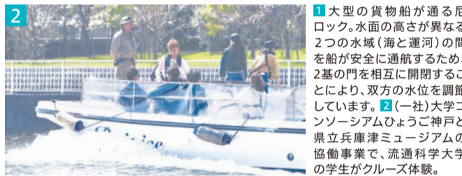
1 大型の貨物船が通る尼ロック。水面の高さが異なる2つの水域(海と運河)の間を船が安全に通航するため、2基の門を相互に開閉することにより、双方の水位を調節しています。2 (一社)大学コンソーシアムひょうご神戸と県立兵庫津ミュージアムの協働事業で、流通科学大学の学生がクルーズ体験。