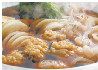
ハモの皮側を下に向け、鍋の中へ。身が丸まれば食べ時です。

☎(一社)淡路島観光協会 ☎0799-22-0742 ☎0799-24-4470 淡路島グルメガイド ハモ