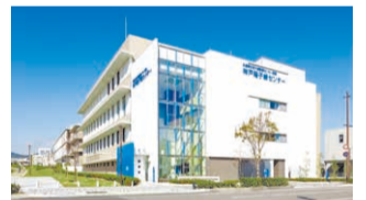
ポートアイランドに立つ神戸陽子線センターは三宮からポートライナーを利用して約20分の好立地。

県立粒子線医療センターは、陽子線と重粒子線の2つの粒子線治療を行うがん治療専門病院です。2001(平成13)年の開設以来、1万例を超える治療実績を誇ります。粒子線治療はがん細胞の周りの正常な細胞を傷つけにくく副作用が少ないという特長があり、手術のように体を切り開くこともないので通院治療が可能です。県立こども病院に隣接する神戸陽子線センターは、約2割が小児がん治療の患者さんです。がん治療の一つとして粒子線治療をご検討ください。(県立粒子線医療センター、神戸陽子線センター)