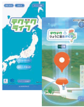
テクテクライフとは… 全国を舞台に訪れた場所を塗りつぶしていく無料のアプリ