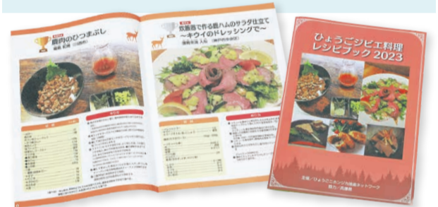
2023年度の入賞・応募作品をまとめた「ひょうごジビエ料理レシピブック」を公開中。ぜひ家庭でお試しください。