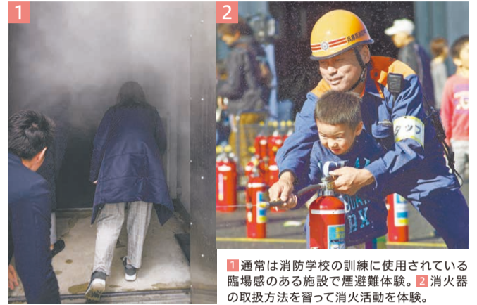
1 通常は消防学校の訓練に使用されている臨場感のある施設で煙避難体験。2 消火器の取扱方法を習って消火活動を体験。

三木市にある県立広域防災センターでは一人一人の防災意識を高めるため、体験型の学習を実施しています。メニューは7つあり、目的や年齢に応じて自由に組み合わせることができます。お薦めは、起震車に乗って震度1から7までの揺れを体感する地震体験と、煙に見立てた水蒸気が充満する真っ暗な通路を進む煙避難体験です。災害の恐ろしさを知ることは備えの第一歩。震度7の揺れがどれほど怖いかを分かっていたら、備えようという気持ちが芽生えます。備える大切さを実感し、自身の防災対策を見直してほしいと思います。他にも、県の備蓄倉庫の見学や消火器取扱体験など、普段はあまり体験できないメニューがそろっています。阪神・淡路大震災から30年を迎える節目に、改めて防災について考えるきっかけにしてください。(県立広域防災センター総務部長 栗原利典さん)