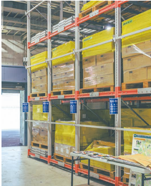
隣接する陸上競技場のスタンド下に約5,000㎡の備蓄倉庫を整備。食料、毛布などの生活用品、携帯トイレなどの衛生用品を黄、赤、青に色分けして保管しています。

三木市にある県立広域防災センターでは一人一人の防災意識を高めるため、体験型の学習を実施しています。メニューは7つあり、目的や年齢に応じて自由に組み合わせることができます。お薦めは、起震車に乗って震度1から7までの揺れを体感する地震体験と、煙に見立てた水蒸気が充満する真っ暗な通路を進む煙避難体験です。災害の恐ろしさを知ることは備えの第一歩。震度7の揺れがどれほど怖いかを分かっていたら、備えようという気持ちが芽生えます。備える大切さを実感し、自身の防災対策を見直してほしいと思います。他にも、県の備蓄倉庫の見学や消火器取扱体験など、普段はあまり体験できないメニューがそろっています。阪神・淡路大震災から30年を迎える節目に、改めて防災について考えるきっかけにしてください。(県立広域防災センター総務部長 栗原利典さん)