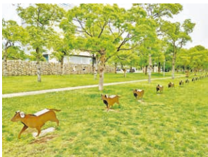
犬モ歩ケバ 藪内佐斗司 1988年