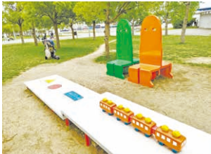
ゆめ・きずな 元永定正、中辻悦子 2001年