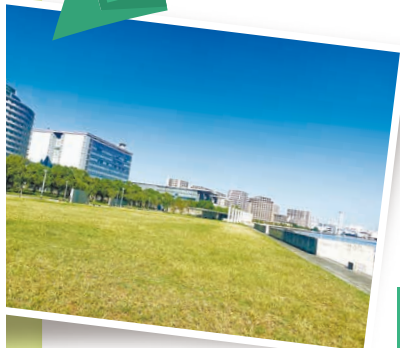
なぎさ公園には広々とした芝生広場も。