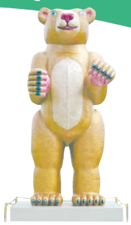
Animal 2021-01-B (KOBÉ Bear) 三沢厚彦 2021年