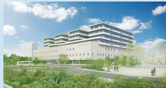
新病院外観のイメージ。