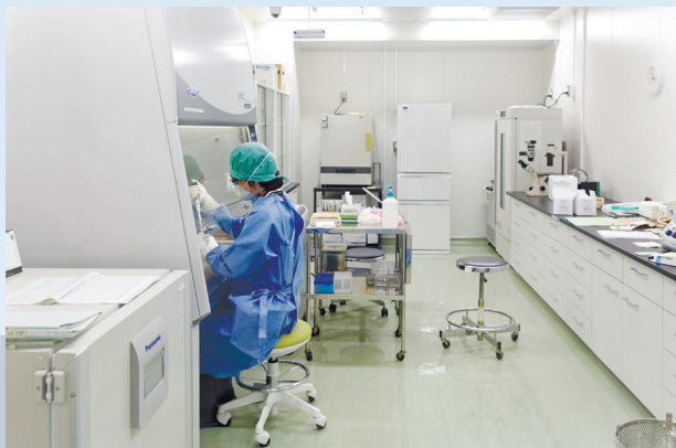
病原体検査の様子。

インフルエンザ等の感染症の発生状況や、花粉の飛散状況(2月～5月末ごろ)をホームページで発信しています。