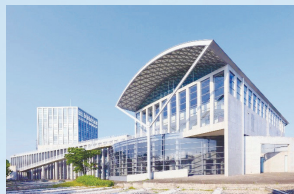
キャンパスは安藤忠雄さんが設計。

毎年恒例の学園祭。健康測定や看護体験等のブースが並びます。入場無料。☎4月26日④10時～15時 ☎同大学明石看護キャンパス