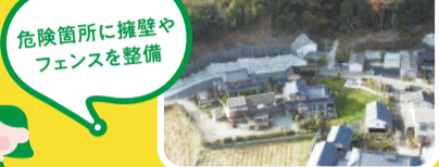
佐用町奥金近地区

崖崩れが発生した際に被害を受ける家屋が多い危険な箇所に、土砂を受け止める擁壁やフェンスを整備する取り組みを進めています。