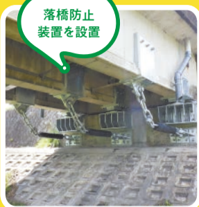
曾我井橋(たつの市)

災害に強い安全な道路ネットワークを構築するため、落橋を防ぐ装置の設置をはじめ、地震の被害を減らす取り組みを進めています。