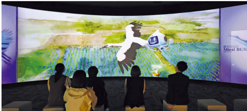
「HYOGOミライバス」は9時30分から45分置きに上映。

昨年開催された「大阪・関西万博」には県や県内企業も出展しました。多くの来場者の注目を集めた展示物をレガシー(遺産)として残そうと、一部は県内施設への移設が進み、3月下旬以降、順次公開されています。(取材・文 本紙編集部)