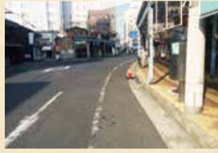
リニューアル工事前

高速船(ジェノバ)乗り場への通り道で、魚の棚や明淡商店街に面する県道明石高砂線のリニューアル工事が28年10月31日に完成しました。まちの玄関口でもあることから、景観や道路形状等について、地元の皆さんと意見交換しながら、整備を進めました。(明石市本町)