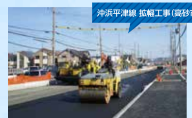
沖浜平津線 拡幅工事(高砂市)