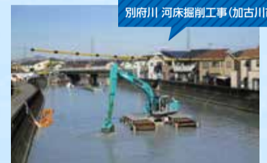
別府川 河床掘削工事(加古川市)