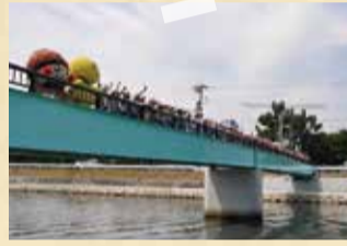
伊保小学校児童による渡り初め