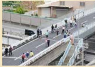
通行再開を記念して開催したウォーキングイベント