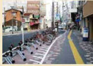
リニューアル工事後