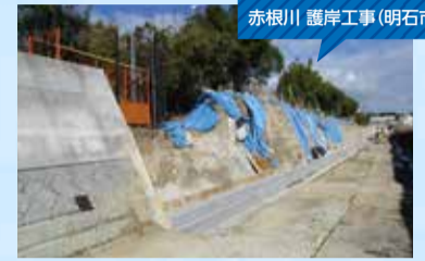
赤根川 護岸工事(明石市)