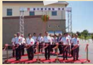
新曇川ポンプ場完成式典