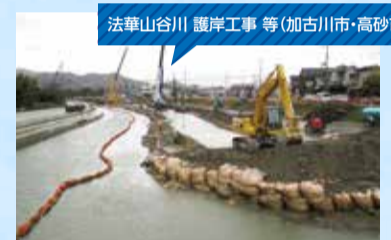
法華山谷川 護岸工事等(加古川市・高砂市)