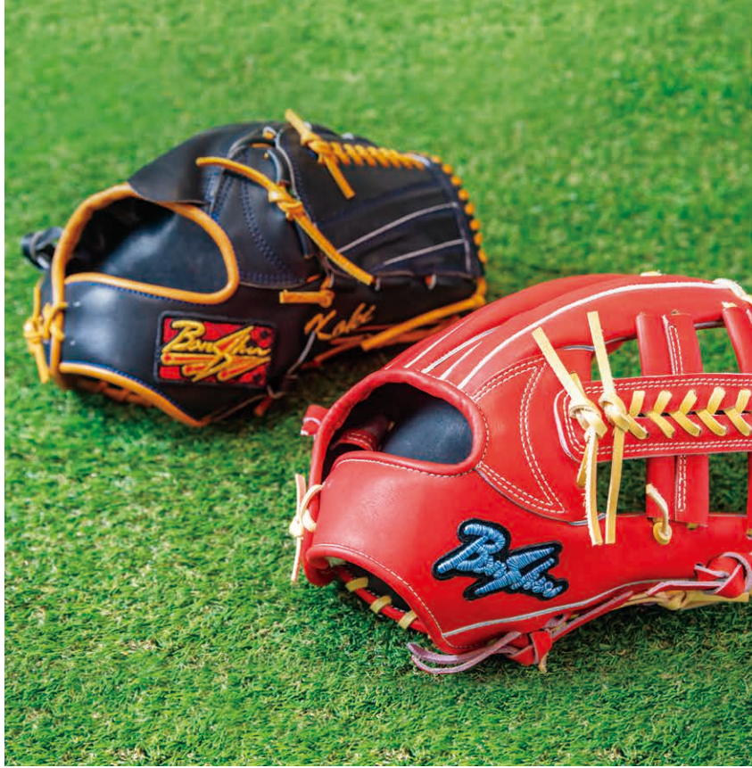
全5色あり、軟式用3万8,500円～、硬式用5万5,000円～。 写真奥は播州織風ラベル付き。

野球一筋 西脇市鹿野町448-1 ☎0795-27-7077 ☎0795-23-4751 野球一筋