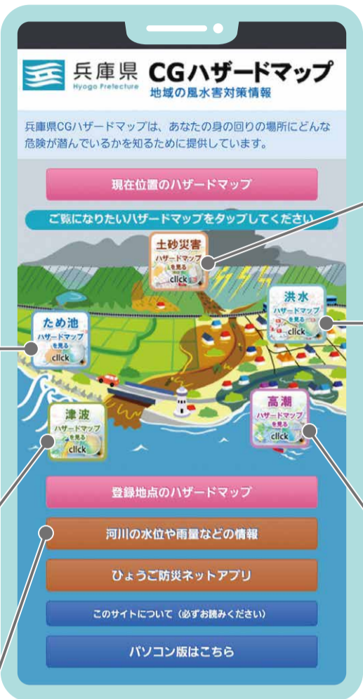
《スマートフォン版》