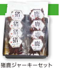
猪鹿ジャーキーセット