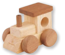
アイコニー オルゴールトレイン

※原皮から生産した皮を100%使用し、県内でなめした革。廃棄物処理を適正に行っている工場で製造されたものだけが認定される