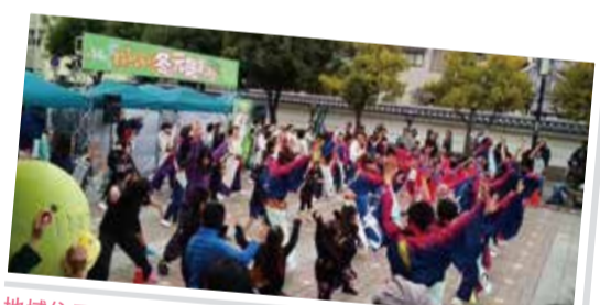
地域住民によるイベント

問 阪神北県民局総務防災課(ビジョン担当) ☎0797-83-3119 ☎0797-86-4379