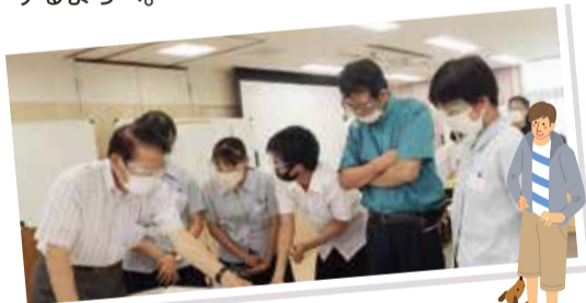
多世代交流による地域学習