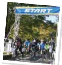
サイクルイベント