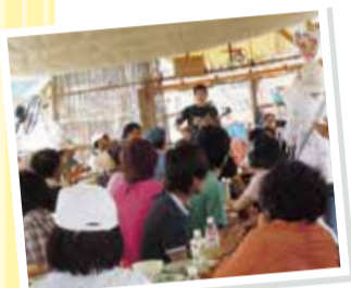
地域でのイベント

情報通信技術(ICT)や人工知能(AI)で起業やまちづくりなどの挑戦をサポートする一方、ゆとりを持った暮らしを実現するなど、コ・クリエーション(共創)の基となる多様な「個」が活躍できるまちへ。