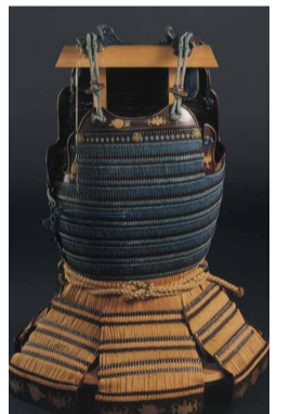
はなだいたげんくれないおどろまる 繻糸下散紅威胴丸 (大阪城天守閣蔵)

ら江戸時代に焦点を当てた展示会を開催します。新発見、初出品の古文書から武具、屏風など多彩で貴重な品々を楽しんでください📅10月15日(土)~12月4日(日)9時~17時(入館は16時30分まで)※月曜、11月4日(金)、24日(土)は休館📍同館📍一般400円、65歳以上200円、学生100円📍同館☎0791-63-0907 📠0791-63-0998