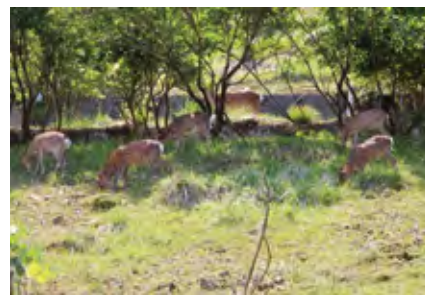
左) イーマキーナ代表の藤井誠さん。害獣忌避装置を手に。 上) 新温泉町の学校では鹿の被害に悩まされていた。