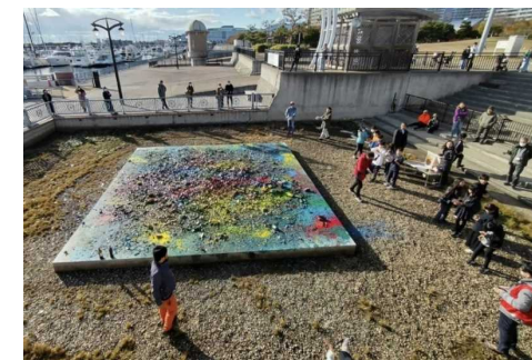
100年続けるアート「平和の証」 瓶投げアート公開制作

阪神南地域発祥で海外でも評価の高い「具体」美術の認知度を高めるため、作家や芸術活動にゆかりのある場所などが掲載されたデジタルマップ等を作成