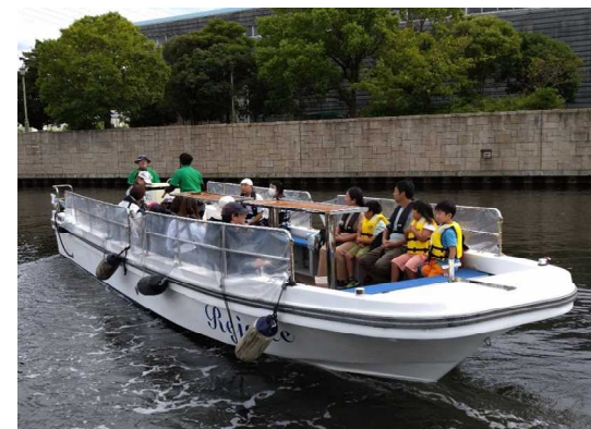
尼崎運河クルーズ