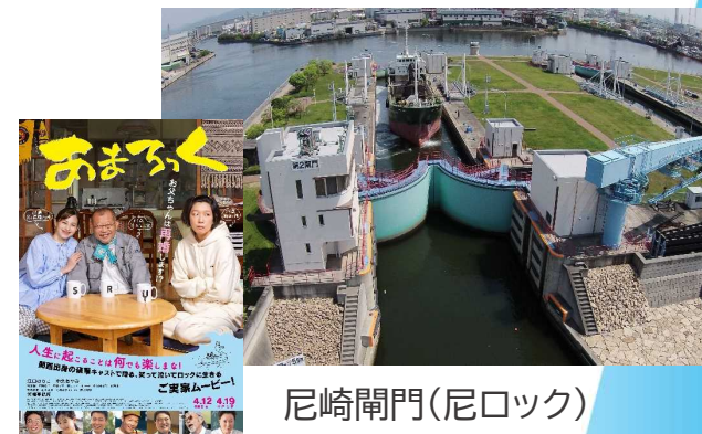
尼崎閘門(尼ロック)

* 令和6年4月12日(金)兵庫県先行、4月19日(金)より全国公開の“ご実家ムービー！”