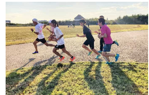
アスリートによるランニング教室

尼崎スポーツの森でリレーマラソンやランニング教室、子どもラグビーなど大人から子どもまで、誰もが参加・交流できるスポーツイベントを開催（10月）