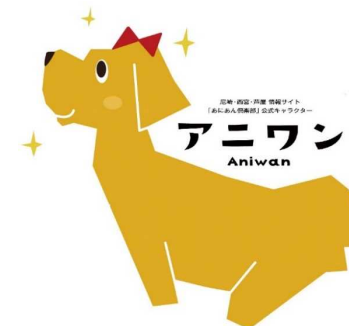
あにあん倶楽部「アニワン」

あにあん倶楽部ホームページをリニューアルするとともに、阪神南地域のフィールドパビリオンなど、魅力あるコンテンツを活用したイベントを開催 New!