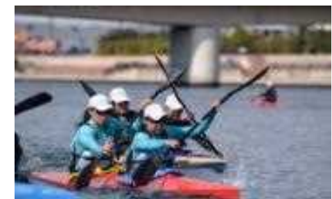
芦屋キャナルパーク

阪神臨海部におけるマリンスポーツに適した環境や地域の魅力を発信するとともに、新たにマリンスポーツ未経験者を対象とした体験会を開催 New!