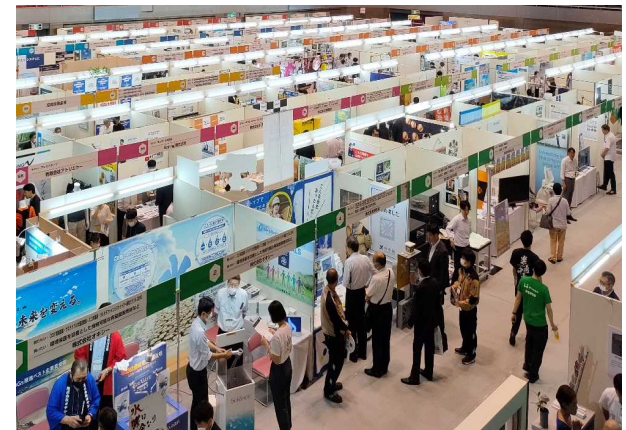
あまがさき産業フェア2023

優れた技術を持つ中小企業と大企業等とのマッチングを目的としたセミナーを開催し、商工会議所等の協力のもと、企業への伴走型支援を実施