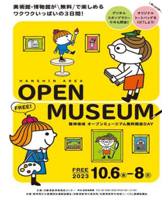
オープンミュージアム無料開放DAY

阪神南地域に多数集積している個性豊かな美術館、博物館など約20施設を無料で開放（10月）