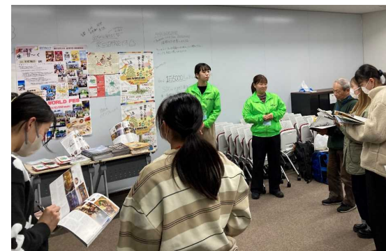
阪神つながり交流祭

大学生が地域活動団体、事業者等と連携して実施する地域活性化に向けた取組を支援するとともに、その取組成果を発表し、相互に交流を図る「阪神つながり交流祭」を開催