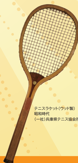
テニスラケット(ウッド製) 昭和時代 (一社)兵庫県テニス協会所蔵