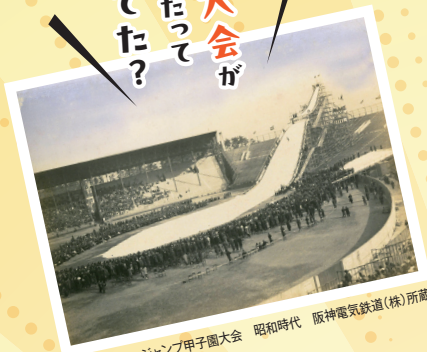
全日本スキージャンプ甲子園大会 昭和時代 阪神電気鉄道(株)所蔵