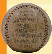
第八回全国中等学校優勝野球大会 兵庫県予選優勝ウィニングボール 大正時代 兵庫県立神戸商業高等学校所蔵