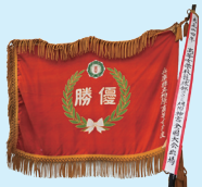
第二回全国競技大会蹴球兵庫県予選優勝旗 大正時代 兵庫県立柏原高等学校蔵

明石高校、芦屋高校、小野高校、柏原高校、神戸高校、 神戸商業高校、洲本高校、長田高校、西脇工業高校、姫路東高校、 兵庫高校、社高校、夢野台高校 (五十音順、敬称略)