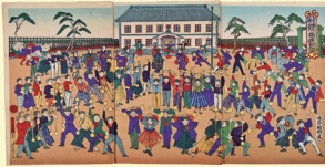
学校体操運動図 明治時代 兵庫県立歴史博物館蔵

幕末の兵庫（神戸）開港後、多くの外国人がやってきて、居留地や六甲山で野球やゴルフなどの近代スポーツを楽しみました。やがて日本人たちも彼らとの交流を通じて近代スポーツにふれ、たちまちその魅力に取りつかれました。本展覧会では、明治・大正・昭和初期のスポーツ史を県内に残る用具や記念品などからたどるとともに、その歴史が紡がれた先にいる現代の“ひょうごスポーツ人”を紹介します。