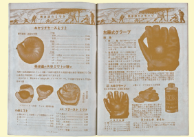
美津濃の運動用品カタログ 大正時代 兵庫県立歴史博物館蔵