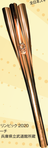
東京オリンピック2020 聖火トーチ 現代 兵庫県立武道館所蔵