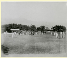
東遊園地 明治時代