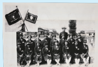
第六回極東オリンピック蹴球優勝選手団集合写真 大正時代