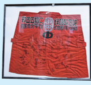
第十九回 全国中等学校優勝野球大会記念陣羽織 昭和時代 兵庫県立明石高等学校蔵