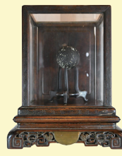
服部知事が打ったボール 明治時代 (一社)神戸ゴルフ倶楽部蔵