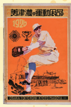
美津濃の運動用品カタログ 大正時代 兵庫県立歴史博物館所蔵