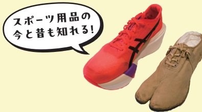
陸上シューズの今昔(マラソントビとメタスピード) 昭和時代・現代 (株)アシックス蔵