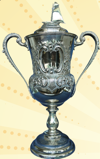
REGATTA CUP