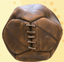
サッカーボール (一社)神戸フットボールクラブ所蔵