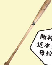
近本光司選手使用バット 現代 兵庫県立社高等学校蔵