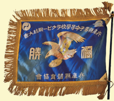
兵庫県男子中等学校ラグビー蹴球大会優勝旗 昭和時代 兵庫県立兵庫高等学校蔵