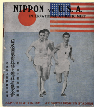
日米国際対抗陸上競技近畿大会パンフレット 昭和時代 兵庫県立歴史博物館蔵