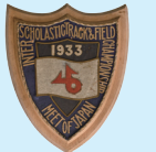
第十九回全国中等学校陸上競技対校選手権大会優勝盾 昭和時代 兵庫県立小野高等学校同窓会(健鈴会)蔵