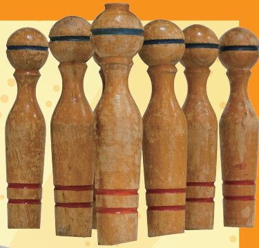
ボウリングピン 神戸六甲ボウル所蔵