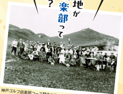
神戸ゴルフ倶楽部コース開き当日 明治時代