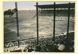
甲子園球場アルプススタンドの出現 昭和時代