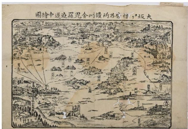
大坂ヨリ播磨名所讚州金比羅迄道中繪圖 （関西大学図書館蔵、江戸時代） 大坂から金比羅へ向かう経路を示した絵図