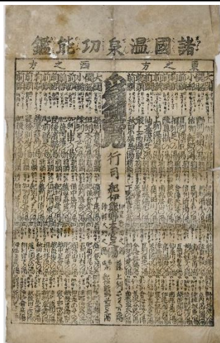
諸国温泉功能鑑（関西大学図書館蔵、江戸時代） 相撲番付風に温泉をランク付け。有馬は西の大関、城崎は西の関脇と関西の1・2位を飾る。