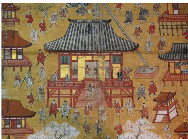
中山寺参詣曼荼羅（部分、中山寺蔵、桃山時代） 中山寺を参詣する人々（巡礼者）を描いた 絵図部分が約155cm×140cmの掛け軸。