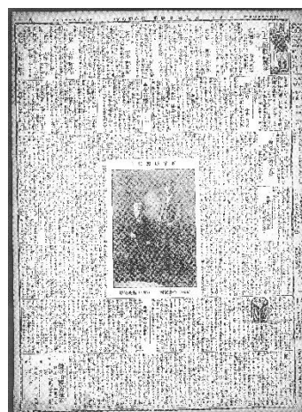
【パネル展示】大阪毎日新聞 明治38年10月8日付 西国巡礼の近代化が分かる巡礼競争に関する記事