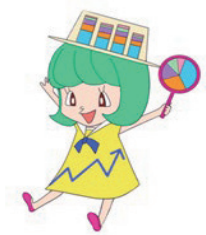
兵庫県統計協会マスコット グラちゃん

◆兵庫県統計協会及び兵庫県民会館4階「県民情報センター内 統計資料コーナー」で販売しています。