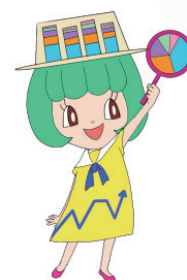
兵庫県統計協会マスコット グラちゃん

兵庫県統計協会事務局 (兵庫県企画部統計課普及調整班内) Tel 078-362-4122