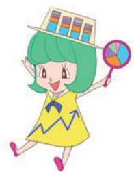
兵庫県統計協会マスコット グラちゃん

◆ジュンク堂三宮店5階、兵庫県統計協会及び兵庫県民会館4階「県民情報センター内 統計資料コーナー」で販売しています。