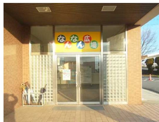
なんなん広場出入口

天満南小学校内に『なんなん広場（交流広場）』の事務室を置き、現役小学校の余裕教室(4室)を地域の人が、いつでも気軽に楽しく利用できるように運営管理しています。また、小学校内に『ふれあい喫茶』コーナーがあり、開かれた学校づくりに協力しています。