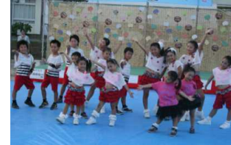
なんなん夏まつり