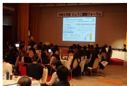
R7. 3. 27 ひょうご躍動フォーラムの様子