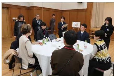
R7. 1. 30 躍動カフェ（丹波地域）の様子