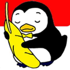
更生ペンギンのホゴちゃん