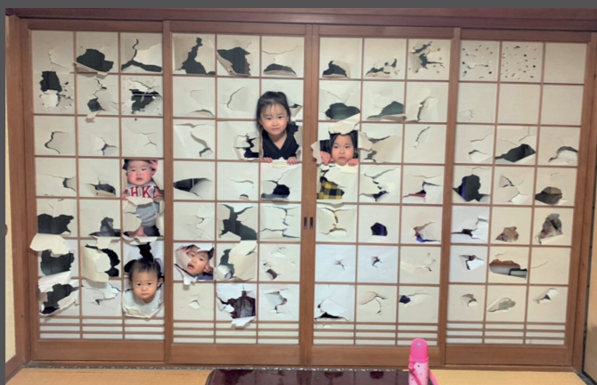
「ゴメンやぶっちゃった 今日だけよ ハイチーズ」