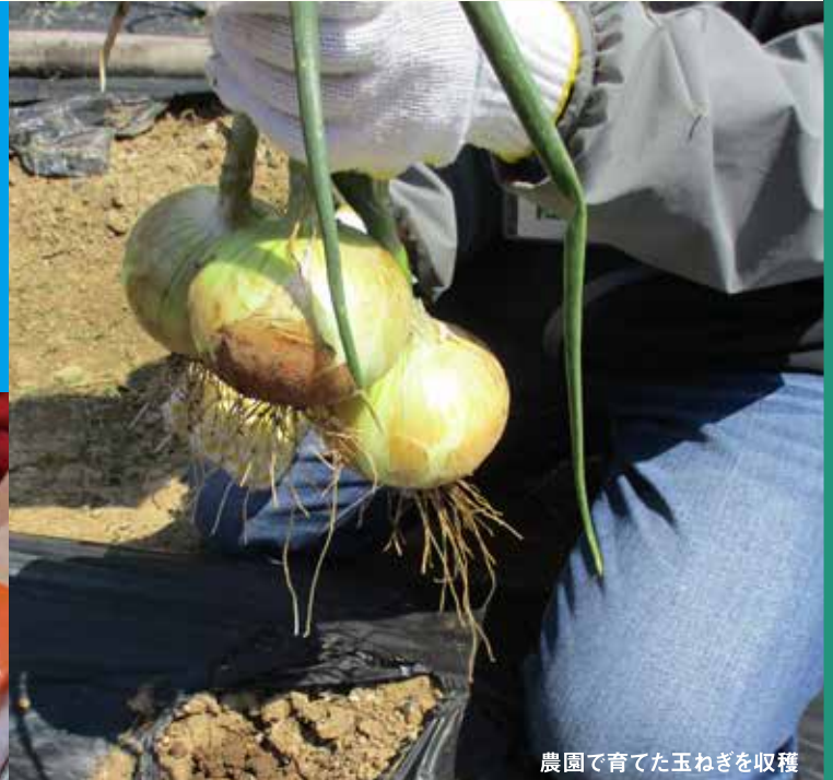
農園で育てた玉ねぎを収穫