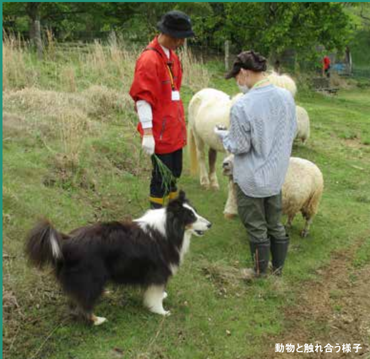
動物と触れ合う様子