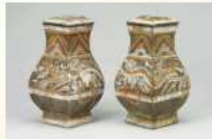
灰陶加彩籠紋紡(漢)