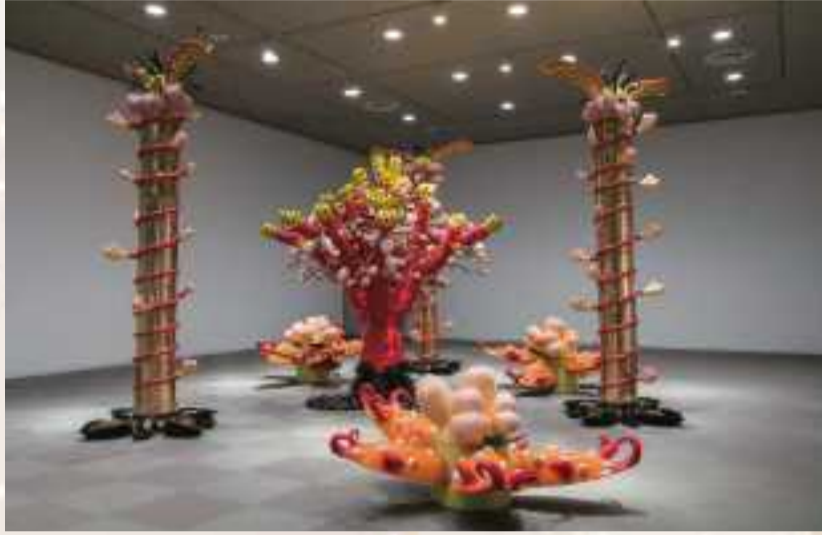
田嶋悦子《Hip Island》1987年 2017年西宮市大谷記念美術館での展示風景 岐阜県現代陶芸美術館蔵