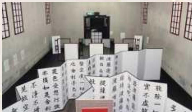
KOSUGI+ANDO (小杉美穂子+安藤泰彦)《芳一-物語と研究》 1987年京都アンデパンダン展(京都市美術館)での展示風景 作家蔵