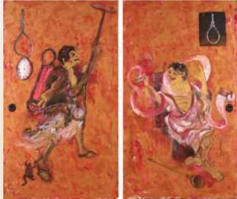
《寒山拾得 2020》2019年 作家蔵