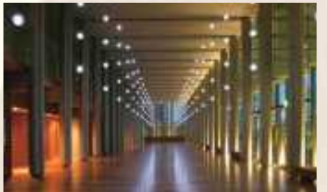
KOBELCO 大ホールホワイエ

※イベントの内容は後日当館ホームページで公開します。 ※7月12日(火)～18日(月・祝)にプレミアム芸術デーのイベントはありません。