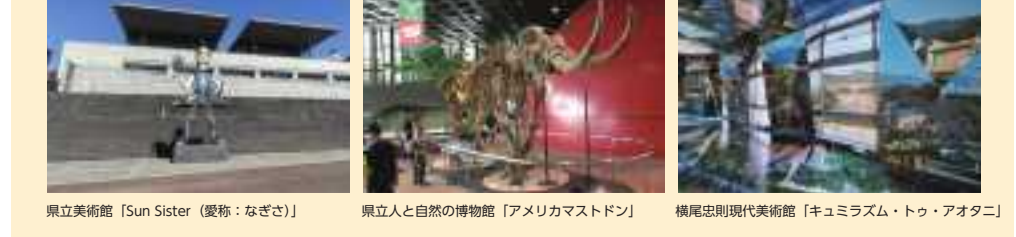
県立美術館「Sun Sister（愛称：なぎさ）」