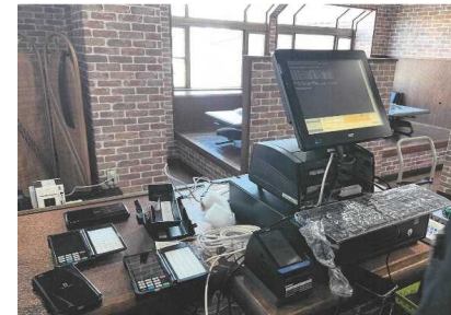
飲食店の注文受注・会計の業務システム化