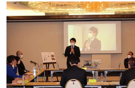
ひょうごフードサポートネット会議の様様