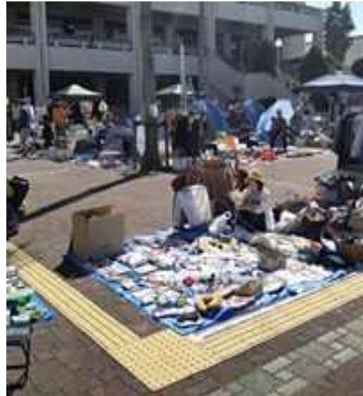
体育の日イベント（毎年10月体育の日・2,500人来場）