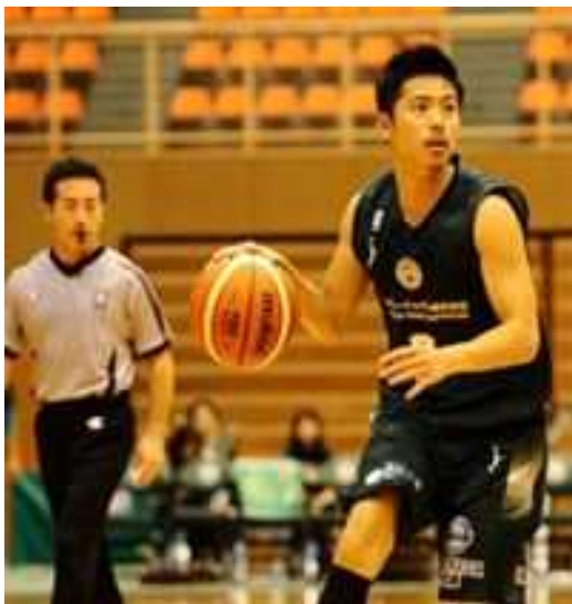
西宮ストークスリーグ戦（9～5月1,000人来場）