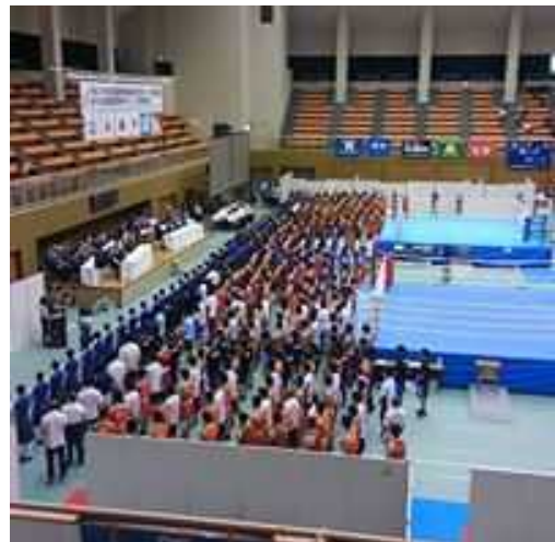
インターハイ会場（7～8月・延べ10,000人来場）